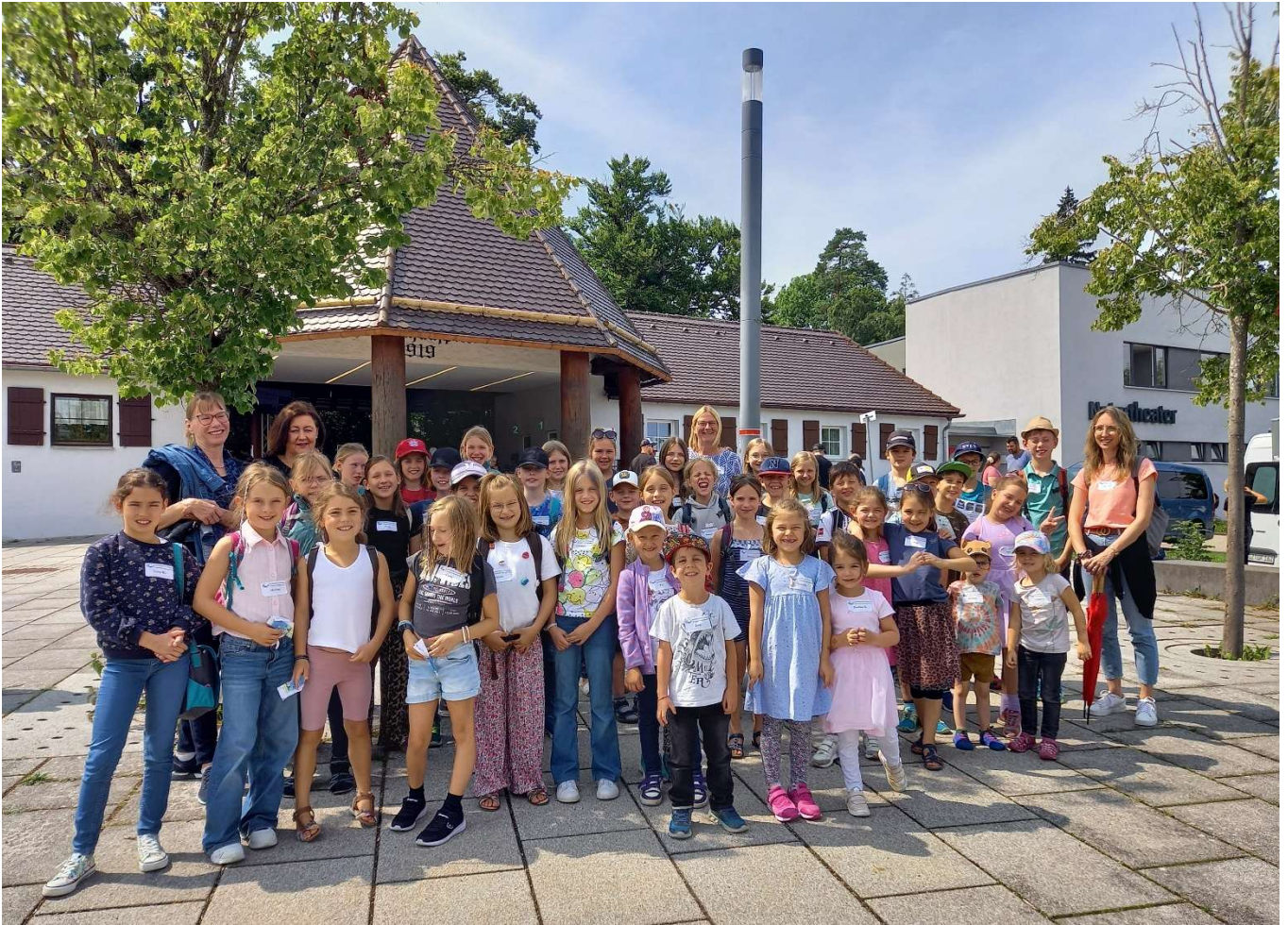
Naturtheater Heidenheim „Alice im Wunderland“ im August 2025

Die beliebte Theaterfahrt nach Heidenheim konnte erneut stattfinden. 51 theaterbegeisterte Teilnehmer*innen ließen sich von „Alice im Wunderland“ verzaubern. Die Fahrt war somit erneut ausgebucht.