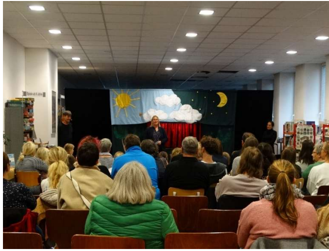
„Tag der Bibliotheken“ mit Theater TOPOLINO