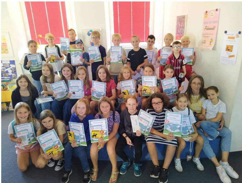
Abschlussparty des Sommerferienleseclub im September 2025

Für jugendliche Leser gab es über die Sommerferien den bewährten „ Sommerferienleseclub “. Hier gab es toppaktuelle Jugendliteratur zu lesen, was in einer Abschlussparty mit Preisverleihung mündete. Dieses Jahr waren es rekordverdächtige 39 Teilnehmer*innen.